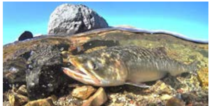
Exemple A - Enlever les rochers ou les barrières pour permettre aux poissons de se déplacer

Les demandes de renseignements ou les commentaires relatifs au plan de compensation peuvent être soumis à l'adresse danni.wu@wsp.com