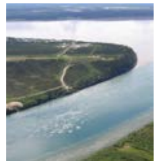
Exemple C - Restaurer l'habitat riverain